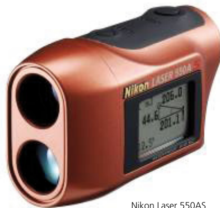
Nikon Laser 550AS