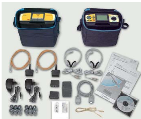
MultiLAN 350 Standard set