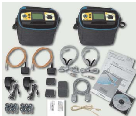
MultiLAN 350 Profi set